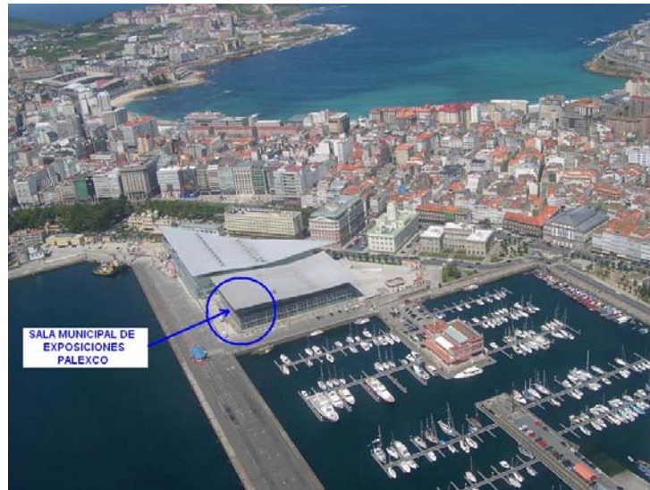
Situación de PALEXCO y del Salón Municipal de Exposiciones

Situación: Avd. Alférez Provisional, en el centro de la ciudad de A Coruña